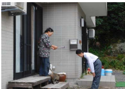
「よろしくお願ひしまーす!」