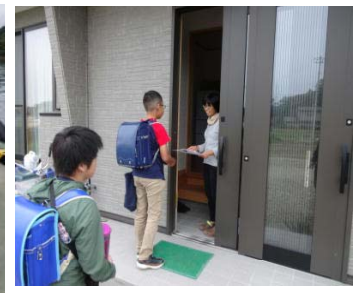
「うくっちゃボトル設置」「来てください」「ありがとう」