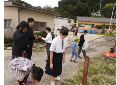
「ゴミはないかな?」「こっちは?」