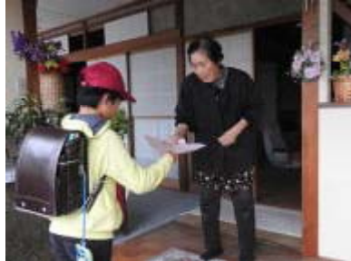
「どうぞ来てください。」「あらー」