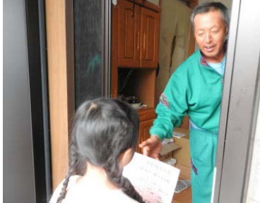
「きてくださいね!」「はーい!」

10月5日は，恒例の文化祭等のチラシ配りと草取り・清掃に加えて，うくっちゃボトルの設置に出かけました。チラシ配り班は4つの班に分かれて島へ渡り，各ご家庭にチラシをくばりました。皆さん温かく迎えてくださり，ありがたかったです。