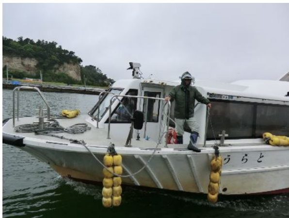
島に行くための船です！その名も「うらと」